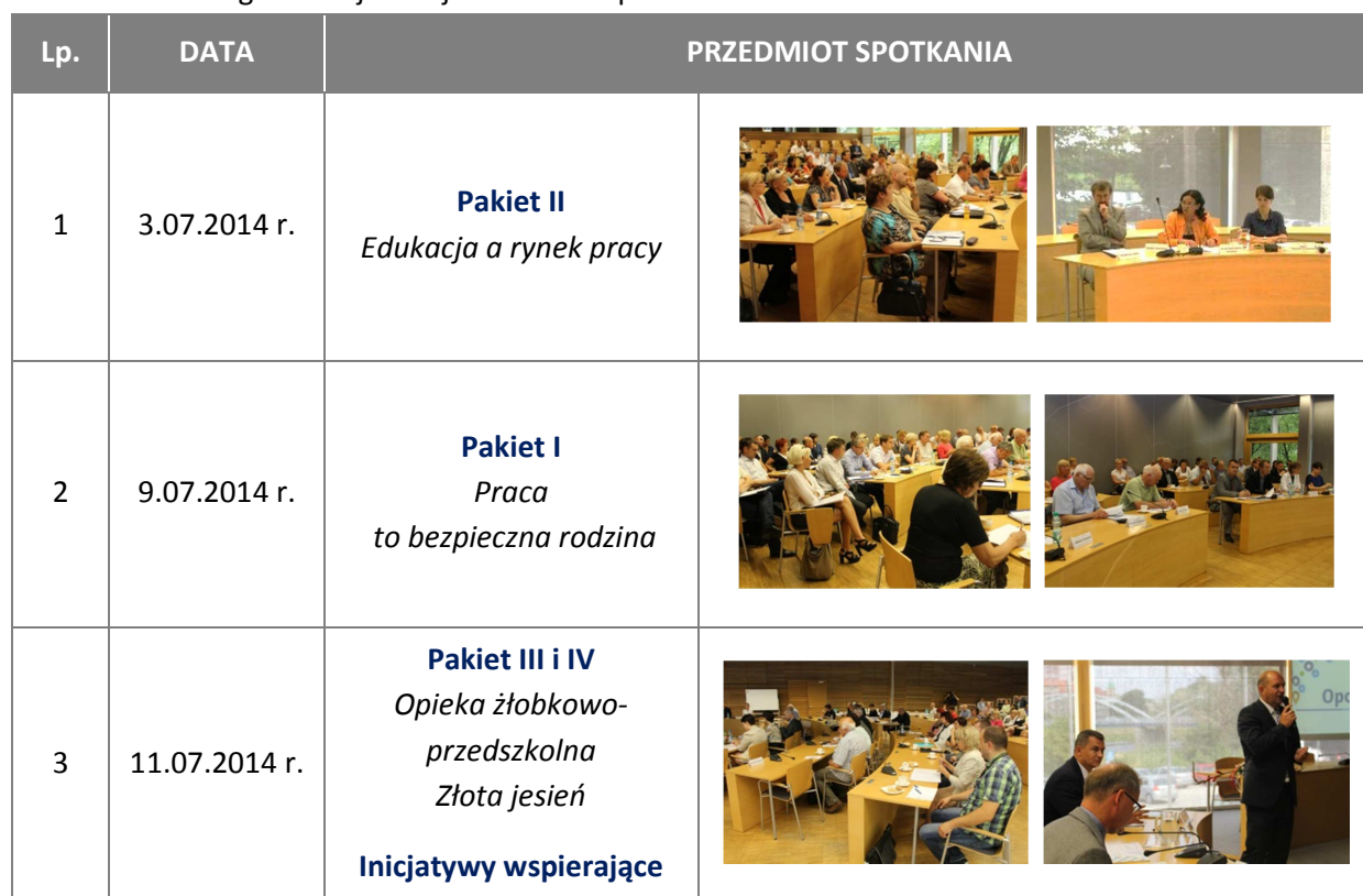
Tabela 1. Zestawienie spotkań w ramach konsultacji społecznych projektu Programu Specjalnej Strefy Demograficznej w województwie opolskim do 2020 r.

Pakiety III - Opieka żłobkowo-przedszkolna i IV - Złota jesień były przedmiotem dyskusji podczas spotkania zorganizowanego 11 lipca 2014 r. Wśród dyskutantów znaleźli się m.in. Wojewoda Opolski, reprezentanci podmiotów działających w sferze szeroko rozumianej ochrony zdrowia i życia ludzkiego, rynku pracy, uczelni wyższych oraz świadczących usługi dla osób starszych.