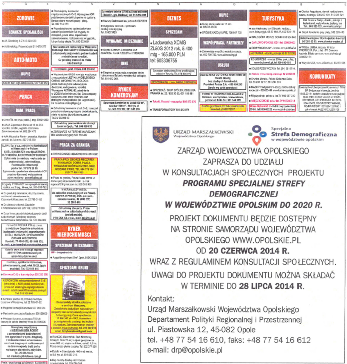
Obraz 1. Informacja o przebiegu konsultacji społecznych projektu Programu Specjalnej Strefy Demograficznej w województwie opolskim do 2020 r. zamieszczona w opolskim wydaniu Gazety Wyborczej 20 czerwca 2014 roku