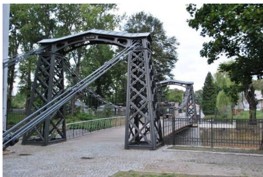
Ozimek, most żelazny, fot. C. Hadamik.