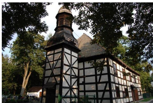
Radomierowice, kościół filialny pw. Wniebowzięcia NMP, fot. C. Hadamik.

Z czterech zachowanych na Opolszczyźnie budynków dawnych synagog (w Opolu, Praszce, Brzegu i Głogówku) dawny kształt architektoniczny zachowały neoklasycystyczny obiekt w Praszce oraz synagoga w Opolu. Ta ostatnia, gruntownie wyremontowana, mieści obecnie siedzibę TVP3 Opole.