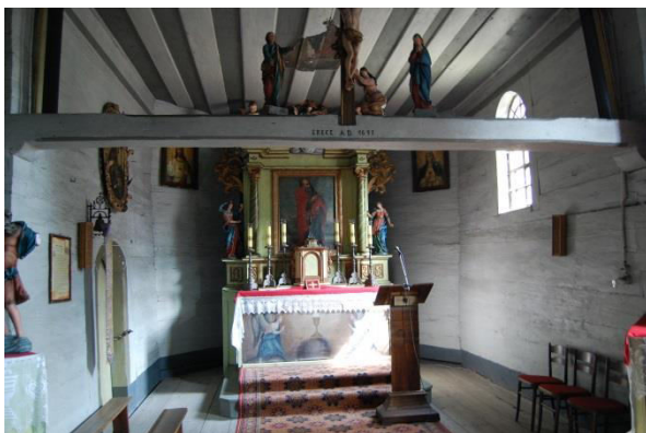
Borki Wielkie

Do zabytków ruchomych zaliczamy m.in. dzieła sztuki i rzemiosła artystycznego, zabytkowe wyposażenie obiektów sakralnych, zamków (Brzeg, Głogówek, Prószków), ratuszy (Brzeg, Otmuchów, Byczyna), jak i niekubaturowe kapliczki, malowidła ścienne, krzyże przydrożne i pokutne. Do rejestru wpisanych jest ponad 7000 zabytków. Na terenie Opolszczyzny działa 14 muzeów, które prezentują zbiory malarstwa, rzeźby, zabytków archeologicznych, numizmatycznych i innych. W Opolu działa między innymi Muzeum Diecezjalne, z bogatymi zbiorami sztuki sakralnej. W 2008 roku Muzeum Śląska Opolskiego zostało wyremontowane i rozbudowane o nową galerię wystawową. Zaadaptowało również kamieniczkę na ul. Wojciecha, urządając w niej muzeum kamienicy mieszczańskiej z pełnym wystrojem z epoki dla poszczególnych mieszkań. Oprócz muzeów miejscami skupiającymi zabytki ruchome są wnętrza obiektów sakralnych. Najliczniej prezentowane są jednolite w charakterze wyposażenia barokowe (ok. 200). Z gotyku zachowało się dużo kamiennych chrzcielnic, freski naścienne, drewniane krucyfiksy i figury świętych. Okres renesansu pozostawił wiele epitafiów, drewnianych ołtarzy, ambon i chrzcielnic.