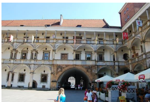
Brzeg, zamek, fot. C. Hadamik.