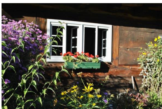
Opole, Muzeum Wsi Opolskiej, fot. C. Hadamik.

w Mosznej. Już obecnie jest to jeden z najbardziej rozpoznawalnych obiektów Opolszczyzny, który może być zarówno scenerią najwyższej rangi wydarzeń kulturalnych, znakomitym planem teatralnym, filmowym i telewizyjnym, jak również miejscem międzynarodowych rokowań, negocjacji i konferencji na wysokim szczeblu, nic przy tym nie tracąc z walorów bardziej lokalnego ośrodka kultury. Inne obiekty, które można wykorzystać do prowadzenia działań promujących dziedzictwo regionu to Ostrówek w Opolu, zamek w Brzegu, zespół zamkowo-parkowy w Rogowie Opolskim, park w Pokoju, Góra Świętej Anny, a także rynki miast historycznych, takich jak Opole, Nysa, Brzeg, Paczków, Głubczyce i inne. Wszystkie te obiekty i przestrzenie umożliwiają tworzenie ofert tematycznych, skierowanych w stronę turysty bardziej wybrednego, miłośnika i znawcy sztuki i kultury wysokiej (wystawy, koncerty, cykliczne konkursy i festiwale), który będzie skłonny spędzić więcej czasu, aby głębiej wniknąć w atmosferę miejsc, które zobaczy tylko tutaj. Rynki miejskie można wykorzystać w celach promocyjnych, jako przestrzenie wystawiennicze, oraz informacyjnych (dotyczących wydarzeń związanych z szeroko pojętym dziedzictwem kulturowym).