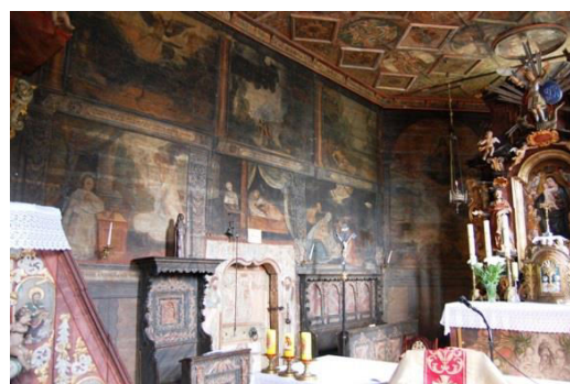
Michalice, wnętrze kościoła, fot. C. Hadamik.