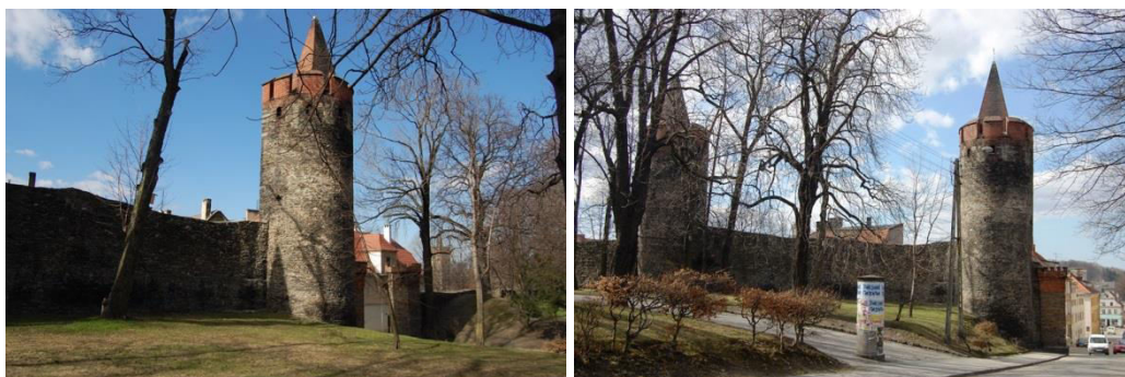
Paczków, fortyfikacje miejskie, fot. C. Hadamik.