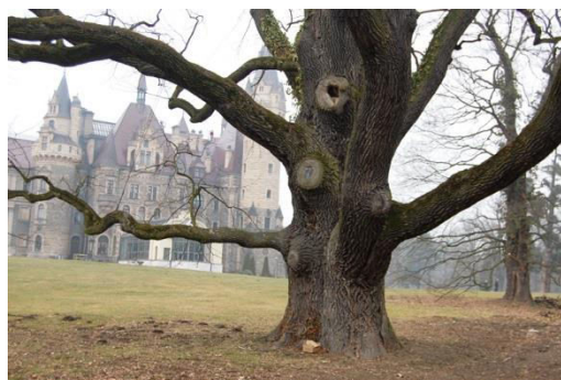
Moszna, park, fot. C. Hadamik.