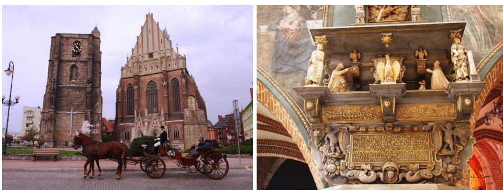
Nysa, zespół kościoła farnego pw. św. Jakuba i św. Agnieszki, fot. C. Hadamik.

unicestwiły również otoczenie fary. Zespół jest jednak do dziś dominantą w krajobrazie miasta.