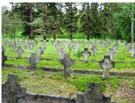
Lambinowice, Stary Cmentarz Jeniecki, fot. C. Hadamik.