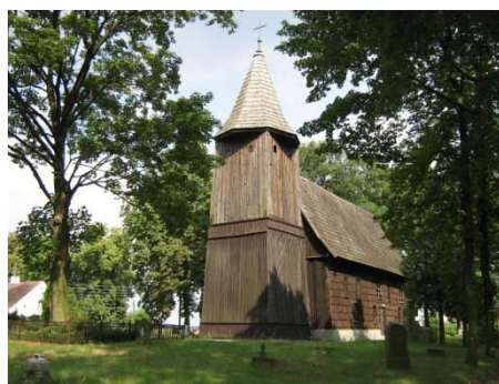
Gierałcice, kościół pw. Św. Michała Archanioła, fot. C. Hadamik.