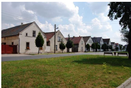
Jemielnica, układ ruralistyczny, zabudowa pierzei ulicy wiejskiej, fot. C. Hadamik.

(Pokój) lub rzędówka brzegowa o dwóch równoległych drogach wzdłuż płynącego środkiem potoku (Grobniki, Łąka Prudnicka, Grodziec). W wielu wsiach zachowane są też charakterystyczne dla różnych rejonów Opolszczyzny rozplanowania zagród, a także ulice wiejskie z gęstą zabudową złożoną z domów ustawionych szczytami do ulicy. Cztery układy ruralistyczne zostały w latach 50. i 60. wpisane do rejestru zabytków (Grobniki, Jemielnica, Ścinawa Nyska i Pilszcz, wobec którego prowadzona jest procedura skreślenia z rejestru). Powołany przez Wojewodę Opolskiego zespół, który w latach 2008-2010 prowadził waloryzację zabytkowego zasobu wsi w granicach regionu, ocenił na podstawie szeregu przyjętych kryteriów, że 53 wsie Opolszczyzny mają wybitne, bardzo wysokie oraz wysokie walory zasobu kulturowego. Wśród nich do najcenniejszych zaliczono: Stary Paczków, Złotogłowice, Klisino, Jemielnicę, Strzeleczyki, Różynę i Raławice Śląskie.