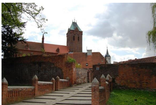
Byczyna, fortyfikacje miejskie, fot. C. Hadamik.

Z dwóch nowożytnych twierdz Śląska Opolskiego, wcześniejszą i bardziej złożoną genezę ma twierdza Nysa, której początki sięgają schyłku XVI w., kiedy powstały pierwsze fortyfikacje w systemie staroholenderskim. W połowie XVIII w., kiedy Nysa znalazła się w granicach państwa pruskiego, umocnienia zostały (na polecenie Fryderyka II) wydatnie rozbudowane (w tzw. systemie staropruskim), zastosowano w czasie tych prac rozwiązania nowatorskie, wyprzedzające ówczesną myśl fortyfikacyjną. Kolejne prace przy umacnianiu i rozbudowie twierdzy prowadzono w XIX w. Obecnie ten rozległy obszarowo obiekt jest jednym z najlepiej zachowanych reliktywów nowożytnych fortyfikacji na Śląsku. Prowadzone są prace nad jego zagospodarowaniem turystycznym. Znacznie gorszy jest stan zachowania reliktywów twierdzy Koźle, wzniesionej w zasadniczym zrębie w XVIII w., zlikwidowanej już w ostatniej ćwierci XIX stulecia. Zarysy kleszczowych umocnień widoczne są do dziś w parku miejskim, udostępnione są też dla potrzeb ruchu turystycznego nieliczne zachowane obiekty twierdzy.