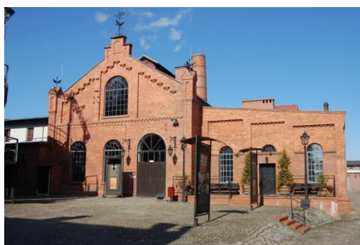
Paczków, Muzeum Gazownictwa, fot. C. Hadamik.