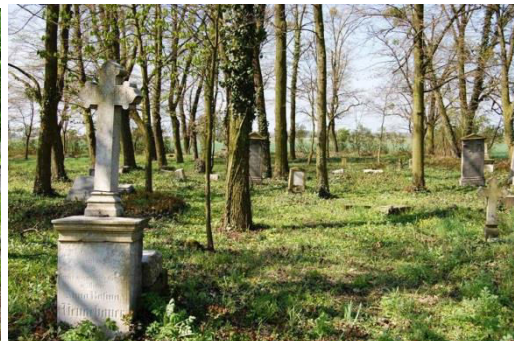
Wronów, cmentarz ewangelicki, fot. C. Hadamik.