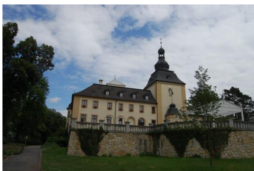
Kamień Śląski, pałac.

Spośród zamków reprezentacyjnym obiektem Opolszczyzny jest zespół w Brzegu (nazywany „Śląskim Wawelem”), a także niewielki, ale znaczący wizerunkowo relikwiarz średniowiecznego zamku w Opolu (Wieża Piastowska), obydwa obiekty właściwie użytkowane, w dobrym stanie, podobnie jak Górny Zamek w Opolu (regotycyzowany w XIX w.), stanowiący obecnie fragment Zespołu Szkół Mechanicznych. Wspaniały zamek książąt opolsko-niemodlińskich w Niemodlinie zmienił ostatnio właściciela i jest w trakcie prac zabezpieczających, z różnym natężeniem trwają prace w obrębie zamków w Strzelcach Opolskich i Chrzelicach. Niedawno został odzyskany przez lokalny samorząd zamek w Głogówku, co być może pozwoli na właściwe zagospodarowanie tego obiektu. Zamek w Ujeździe został zabezpieczony w formie historycznej ruiny i udostępniony dla potrzeb ruchu turystycznego. W stanie historycznej ruiny pozostaje też zamek w Krapkowicach-Otmęcie. Prace zabezpieczające przeprowadzono natomiast w obiektach w Kędzierzynie-Koźlu i Krapkowicach.