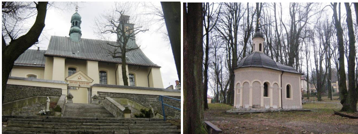
Góra Świętej Anny, bazylika św. Anny i jedna z kaplic kalwaryjskich, fot. C. Hadamik.

nazywaną „Bożą Górą Śląskiej Ziemi” lub „Śląską Perłą”, otoczoną legendami i opowieściami, których tematyka rozciąga się od przedchrześcijańskich kultów pogańskich aż po walki powstańców śląskich.