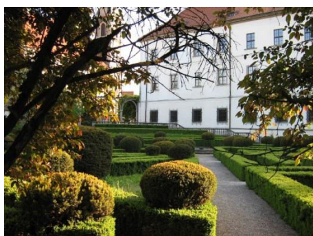
Brzeg, ogrody zamkowe, fot. C. Hadamik.

Nysa, Opole, Prudnik, Strzelce Opolskie, Kędzierzyn-Koźle, Paczków, Głubczyce), ogrody i zespoły zieleni komponowanej. Stan parków pałacowych i dworskich jest prostą pochodną zagospodarowania obiektów architektury. Stan publicznych przestrzeni zieleni jest na ogół dobry, podobnie jak zespołów komponowanej zieleni (np. na Górze Świętej Anny). Jako obiekt wyjątkowy trzeba traktować park-arboretum w Prószkowie, kontynuujący tradycję XIX-wiecznego pruskiego Królewskiego Instytutu Pomologicznego, który właśnie w Prószkowie miał swoją siedzibę. Wizytówką regionu jest też park w Pokoju, dobrze zachowane założenie z XVIII w. (ogród francuski) i XIX w. (park krajobrazowy) o unikalnych wartościach kompozycyjnych i artystycznych.