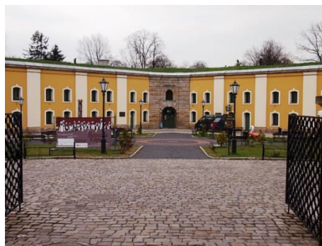
Nysa, twierdza, bastion św. Jadwigi, fot. C. Hadamik.