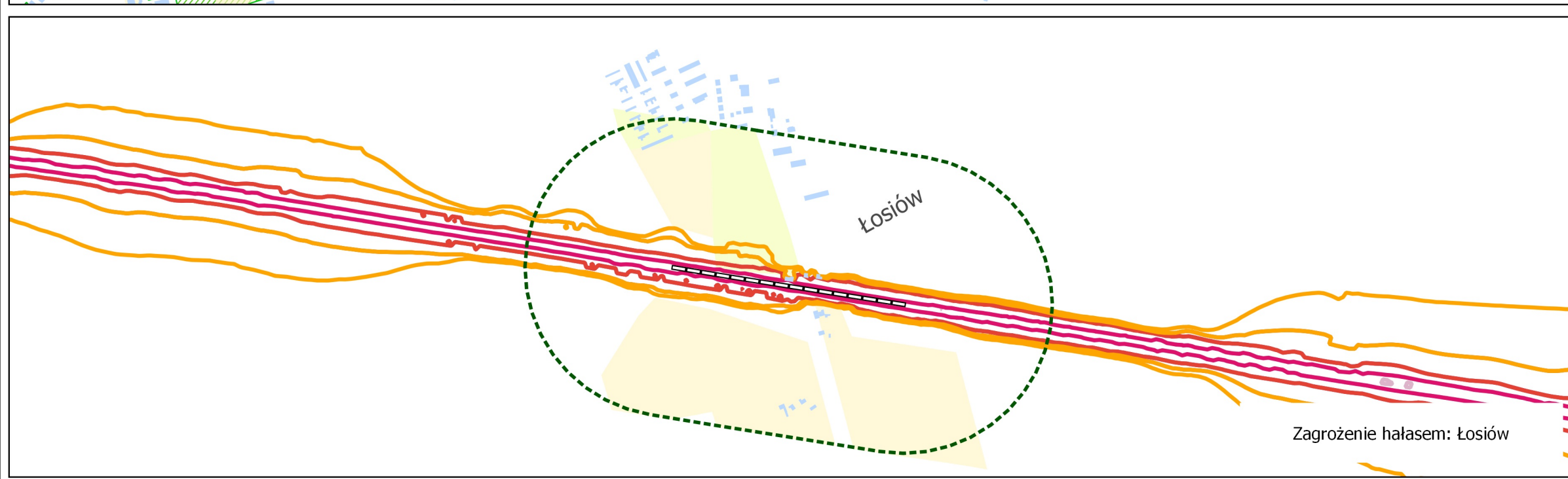
Zagrożenie hałasem: Łosiów